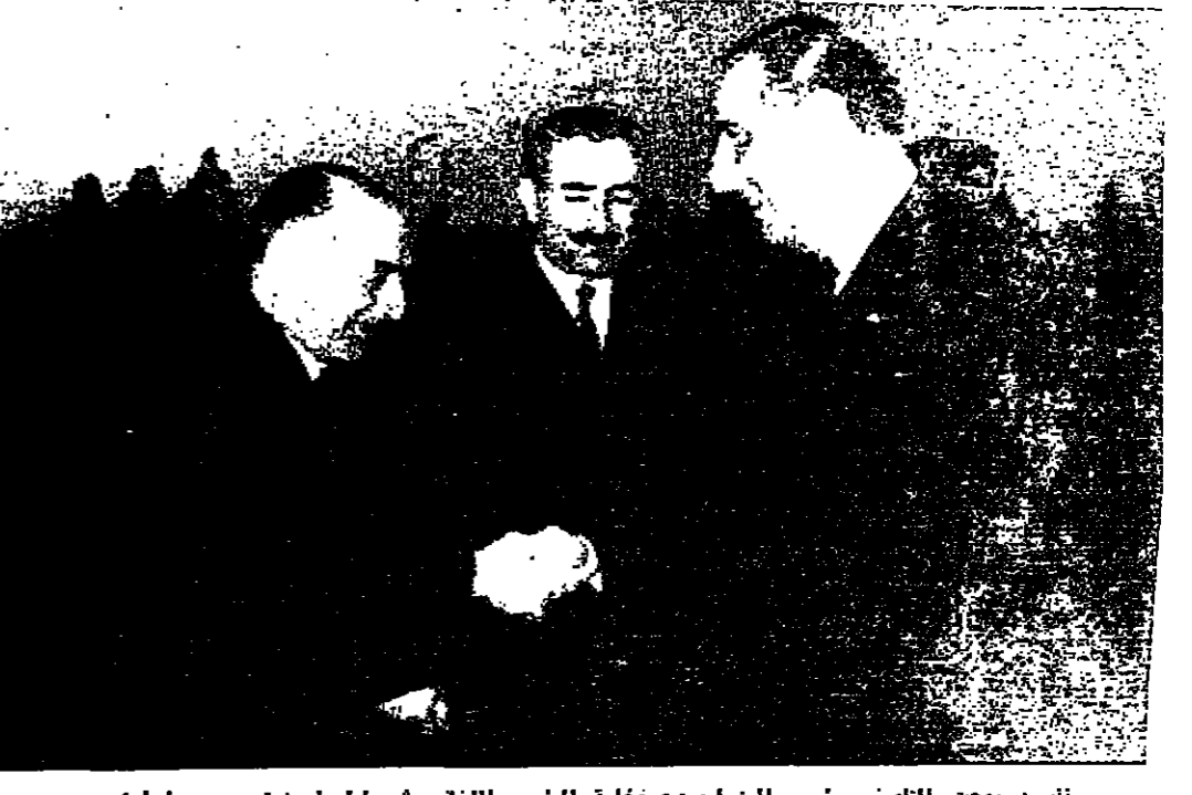
تسليم بعثة القنولي رئيس الوزراء وبعثة فخامة الرئيس اللبناني لشارل حلو (تصوير ١.١.٥)